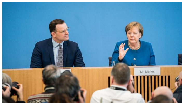
Abbildung 1: Bundeskanzlerin Angela Merkel und Gesundheitsminister Jens Spahn bei einer Pressekonferenz am 11.03.20